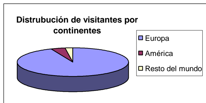
Figura 1. Distrubución de visitantes por continetes